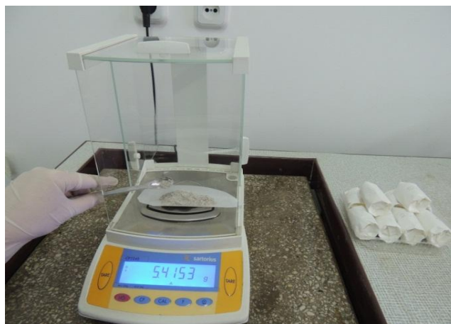
Рисунок 4 – Биохимическая оценка образцов

По первому сроку укоса наибольший показатель зеленой массы был у сортов овса Арман 3,493 кг/м 2 , затем следовал овес Думан 3,227 кг/м 2 . Во втором сроке овес Арман с продуктивностью зеленой массы 3,253 кг/м 2 , у проса лучшими были Укосное 1 и Экспромт (2,923 и 2,812 кг/м 2 соответственно), сорта пшеницы Асыл Сапа и Акмола 2 показали тоже хороший результат - 2,802 и 2,932 кг/м 2 . Неплохой показатель зеленой массы был и у сортов ячменя. Нарастание зеленой массы отмечено во втором сроке у всех культур, к третьему сроку наметилось уменьшение, так как продуктивность фитомассы теряется в связи с началом периода созревания (таблица 2).