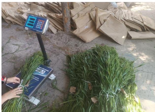
Рисунок 3 – Учет зеленой массы