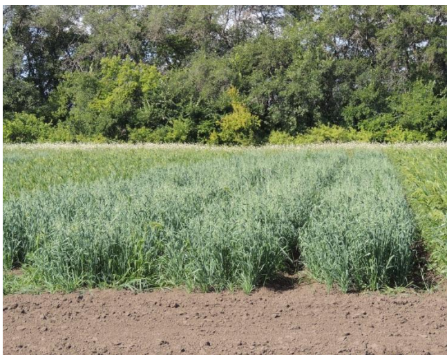
Рисунок 1 – Посевы изучаемых культур

На продуктивность естественных и культурных фитоценозов значительное влияние оказывают плодородие почвы, наличие легкоусвояемых элементов питания, доминирующая сорная растительность, агротехнологические особенности и агроклиматический потенциал региона [12,13,14,15].