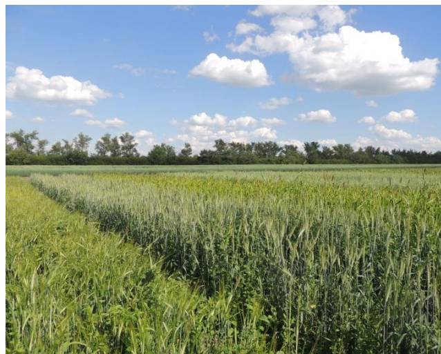
Рисунок 2 – Фаза колошения зерновых

Учет продуктивности зеленой массы изучаемых культур на различных этапах органогенеза и лабораторная оценка его качества позволяет выявить оптимальный период скашивания растений и получение наиболее ценного корма с максимальным содержанием питательных веществ, минералов и микроэлементов. Периоды учета и оценки зеленой массы проводились в три этапа: период начало выметывания - колошение, цветение-молочная спелость, начало восковой спелости. (Рисунок 3, 4). В фазу полной спелости для комплексной оценки хозяйственно-полезных признаков проведен учет семенной продуктивности изученных культур.