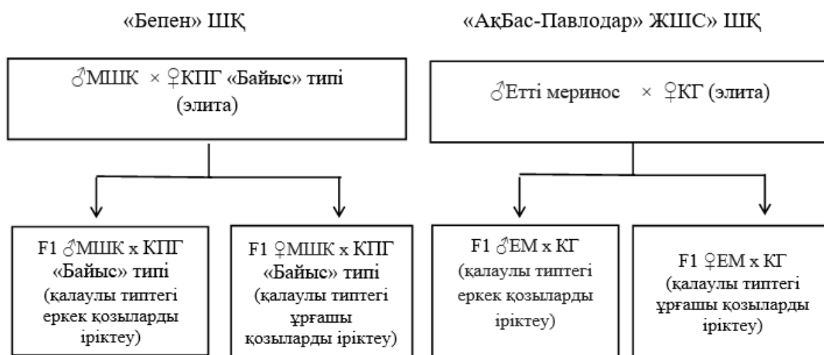
2-сурет – Зауыттық будандастыру сұлбасы

Зерттеу нәтижелері және оларды талқылау. «АқБас-Павлодар» ЖШС» шаруа қожалығында (КГ) және «Бепен» шаруа қожалығында (КПГ тұқымы) тәжірибелік селекциялық схемаларды қолдану қойлардың көбею қабілетін жақсартуға ықпал етті. Бақылау топтарымен салыстырғанда, тәжірибелік топтарда 100 қойға шаққанда қозылар санының артуы байқалды, бұл жалпы өнімділіктің жақсарғанын көрсетеді. Тәжірибелік топтардағы қойлардың ұрықтану деңгейінің жоғары болуы көбею тұрақтылығының сақталуын және енгізілген селекциялық және технологиялық шаралардың орындылығын көрсетеді.