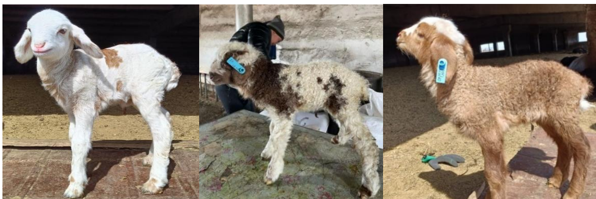
1-сурет – Әртүрлі түсте туылған будан қозылар

Алынған деректер екі шаруашылықта да зауыттық будандастыруды қолдану арқылы туылған қозылардың жүн түсі мен құйрық пішінінің фенотиптік өзгергіштігінің артуын көрсетеді, нарық сұранысы бойынша артықшылыққа ие белгілі бір түрлерді нығайтуға бағытталған асылдандыру жұмыстары үшін жаңа әлеуетті мүмкіндіктер ашатынын көрсетеді. Алынған нәтижелер ата-аналық жұптарды мақсатты түрде іріктеудің өнімділікті арттыру үшін ғана емес, сонымен қатар жас төлдердің қалаулы қасиеттерін дамыту үшін маңыздылығын көрсетеді.