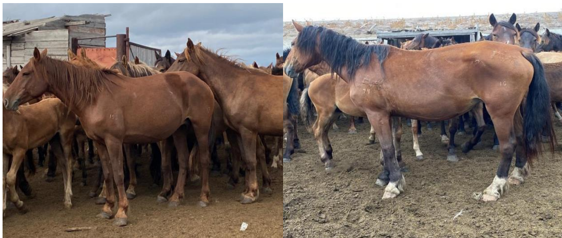
1-сурет – Бесқарағай қазақы жылқы типінің биелері

Екі аталық іздегі зерттелетін белгілер (tr) арасындағы айырмашылықтың сенімділігі 1,48-ден 3,93-ке дейін жоғары сенімді, Стьюденттің кестесі бойынша ықтималдық шегі Р 0,01-ден Р 0,001-ге дейін.