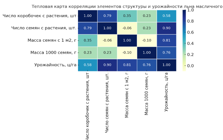
Рисунок 3 – Тепловая карта коэффициентов корреляции между основными показателями продуктивности и урожайностью

Корреляционный анализ подтвердил, что урожайность наиболее тесно связана с числом семян на растении и массой 1000 семян, тогда как высота растений оказывает косвенное и менее выраженное влияние. Выявлены сильные положительные корреляции между урожайностью и числом семян с растения ( r \approx 0,90 ), урожайностью и массой 1000 зерен ( r \approx 0,76 ), а также количеством коробочек и числом семян с растения ( r \approx 0,79 ). Полученные взаимосвязи свидетельствуют о значимости этих признаков в формировании урожая (рисунок 3).